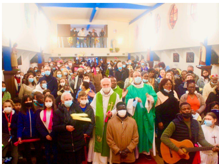
Rencontre avec Herblay