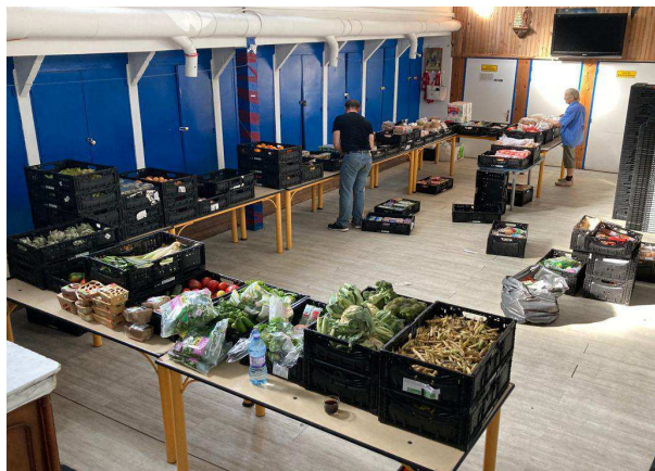
La distribution alimentaire.