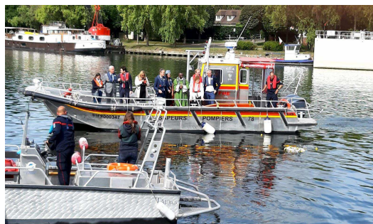
Le pardon de la Batellerie sous le soleil