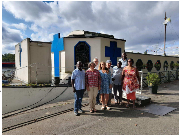
L'Équipe de l'EAP